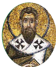
阿玛西亚的 阿斯提乌

分开，无论是身体还是灵魂都是如此。他们确实是二人成为了一体。若已经成为一体，也就成为了一灵。” 56 针对某些谴责婚姻是罪恶的诺斯替主义流派，德尔图良主张婚姻是美好的，尤其是基督徒之间的婚姻更是如此。